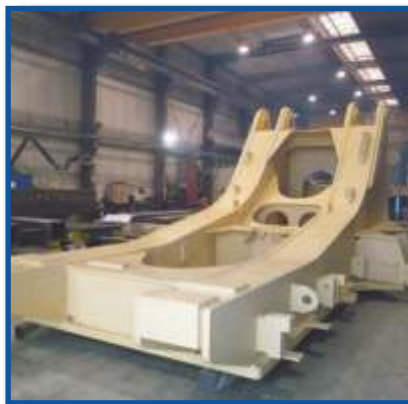
Maschinenchassis für schwere Baumaschinen, 60 to