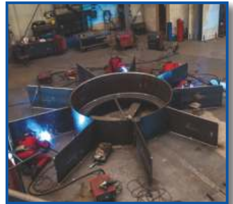
Zentralplattform für Großanlage, 130 to