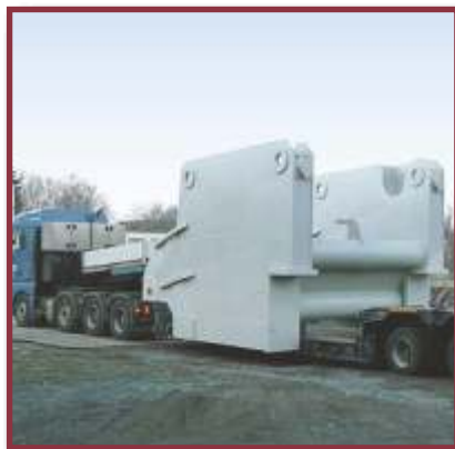
Maschinenrahmen, 55 to