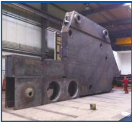
Seitenwand für Schmiedemanipulator, 85 to